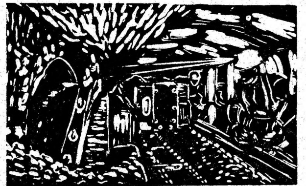
„In abataj“ — gravură de Eliodor Mihăileanu.

(Poezie distinsă cu premiul ziarului „Steagul roșu“ la concursul „Lumini din adîncuri“)