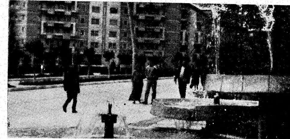
Secvență din noul și modernul cartier Petroșani Nord, carte de vizită reprezentativă a reședinței de municipiu.

LECTURA CU PRIVIRE LA CONVOCAREA CONSFĂTURII COMITETULUI POLITIC CONSULTATIV AL STATELOR PARTICIPANTE LA TRATATUL DE LA VARȘOVIA În conformitate cu înțelegerea realizată, la jumătatea lunii iulie a.c. va avea loc la Varșovia consfătuirea Comitetului Politic Consultativ al statelor participante la Tratatul de la Varșovia.