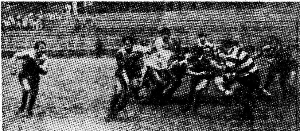
Atac „la mină” inițiat de rugbiștii de la „Știința”.

● In paranteze: „clasamentul adevărului”.