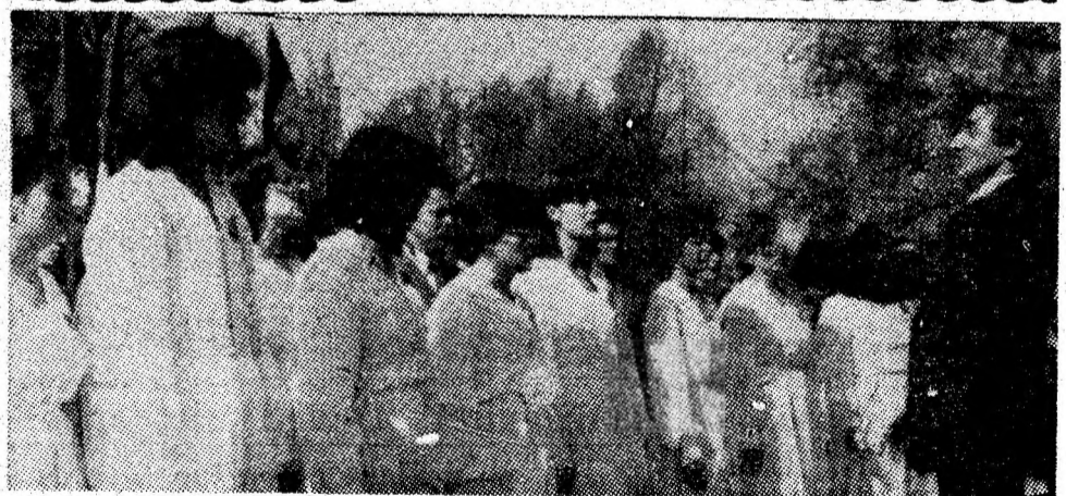
Corul „Armonii tinere“ al I.U.M. Petroșani, formație care și-a cîștigat un bimeritat prestigiu pe scena muncii și creației, Festivalul național „Cîntarea României“, și-a adăugat un nou trofeu la performanțele anterioare, cucerind în cadrul reuniunii corale interjudețene „Ion Vidu“, încheiată duminică, la Lugoj, Premiul I, trofeul „Ion Vidu“ și Premiul special al sindicatelor.

Aplauzele calde ale publicului au subliniat pe deplin remarcabila prezență muzicală și scenică a formației, atît în concurs cît și în spectacolul de gală al laureaților, urmare a interpretării cu multă sensibilitate și acuratețe tehnică a unui repertoriu ce a cuprins șapte lucrări corale executate „a capella“, aparținînd patrimoniului coral românesc și universal, clasic și contemporan.