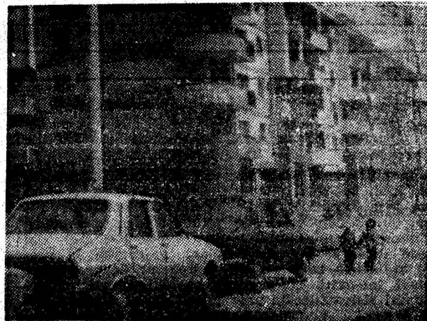
Verticale noi, moderne, în Uricani.