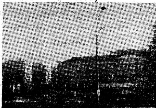
Petrosani — secvență citadină, sub amprenta înnoirilor.

Să înfăptuim exemplar sarcinile și indicațiile secretarului general al partidului, tovarășul NICOLAE CEAUȘESCU