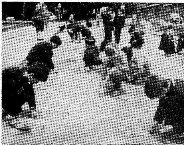
Desenele pe asfalt, pe teme liber alese, posibilități de abordare a măiestriei și fanteziei copiilor.

Totul pare firesc, normal obișnuit și asta pentru că de la Congresul al IX-lea, de cînd se află în fruntea partidului și țării tovarășul Nicolae Ceaușescu, revoluționarul care a ridicat prestigiul României în întreaga lume, omul muncii își valorifică deplin capacitatea creatoare, conștient că prin munca lui contribuie la dezvoltarea patriei, la ridicarea necontenită a nivelului său de trai. Este firesc, este normal, pentru că omul își făurește propriul destin, își asigură prin munca lui un viitor luminos pentru el, pentru copiii săi pentru generațiile viitoare.