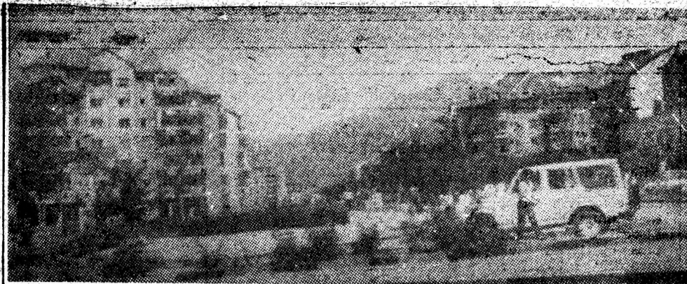
Un cartier care, sub soarele strălucitor al acestei veri, oferă o imagine pe măsura timpului ce-l trăim: Petroșani-Nord.