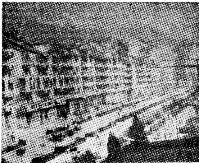
Reședința de municipiu — Petroșaniul, a cunoscut înnoiri fără precedent.

Cu cele mai alese simțăminte de dragoste și recunoștință vă adresăm urarea tradițională de multă sănătate și putere de muncă pentru a conduce pe mai departe patria pe noi trepte ale devenirii socialiste, pentru împlinirea înalțelor idealuri ale poporului de bunăstare și fericire, de pace și progres.