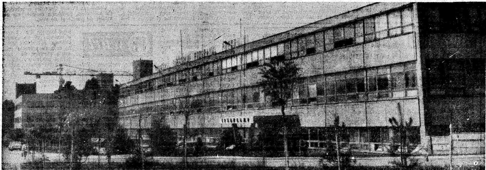
Inscrisă organic în ctitoriile „Epocei Nicolae Ceaușescu”, IPSRUEEM Petroșani reprezintă esența împlinirii dezideratului creării în Valea Jiului a unei platforme industriale cu dotări moderne, capabilă să realizeze mașini, utilaje, echipamente tehnologice și reparații de înaltă tehnicitate pentru minerit.