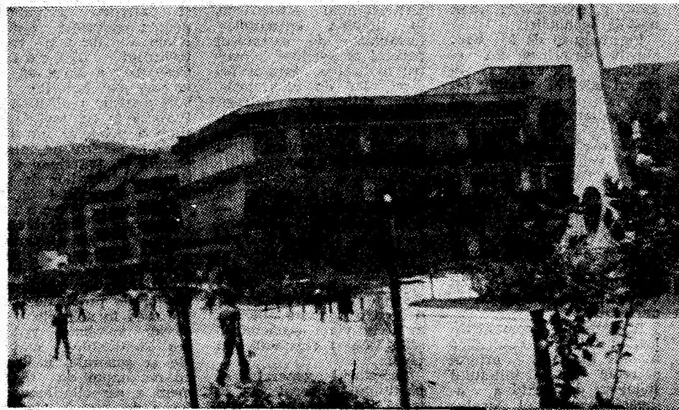
Petrila. Vedere spre magazinul general, obiectiv comercial de atracție pentru locuitorii orașului.