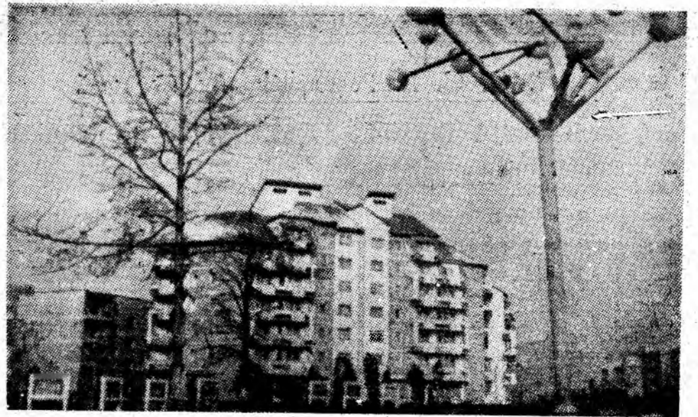
Modernul cartier Petrosani-Nord, în aceste zile de noiembrie.