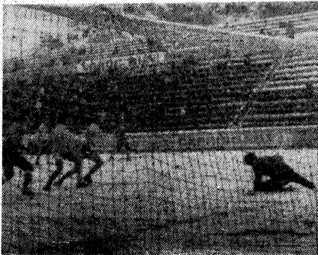
Faza care a premers deschiderea scorului în meciul disputat, duminică, de AS Minerul Paroșeni în compania Gloriei Reșița.

ETAPA VIITOARE (duminică, 4 decembrie): Metalul Mangalia — Dacia Pitești, Electroputere Craiova — AS Drobeta Tr. Severin, Metalul Mija — CS Tîrgoviște, ICIM Brașov — Electromureș Tg. Mureș, Minerul Motru — Sportul „30 Decembrie”, Dunărea Călărași — Tractorul Brașov, FCM Caracal — Metalurg. Slatina, Chimia Rm. Vilcea — Pandurii Tg. Jiu, Gaz Metan Mediaș — Jiul Petroșani.