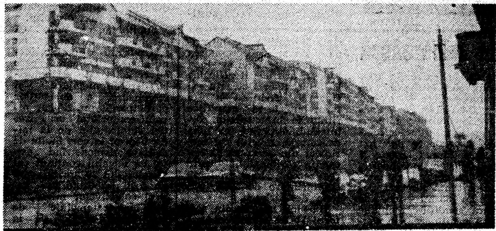
Valențe ale noului în orașul minerilor Vulcan.

70 de ani de la făurirea statului național unitar român