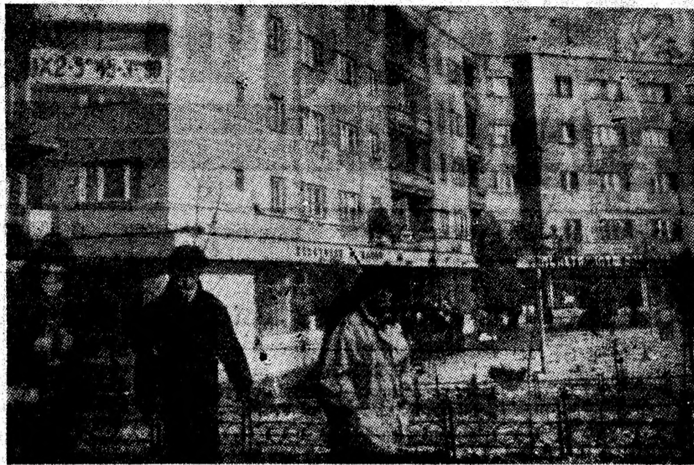
Tineretea orașului de la poalele Vilcamului.

Urînd tuturor colectivelor de oameni ai muncii, în frunte cu comuniștii, noi și importante succese în activitatea anului 1989, în numele biroului și secretariatului Comitetului municipal de partid, adresăm cu prilejul Anului Nou, tuturor locuitorilor Văii Jiului, un călduros „La mulți ani!”.