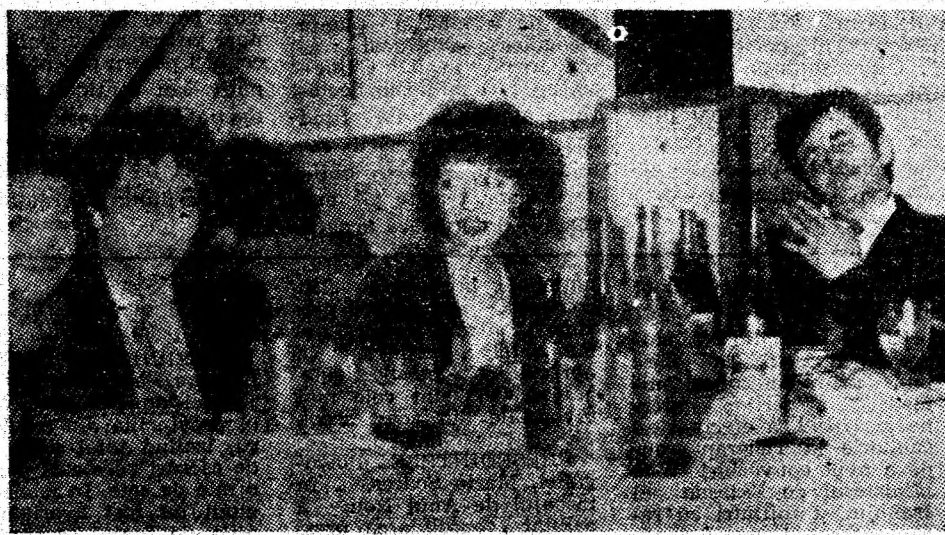
Voie bună la Revelionul constructorilor de mașini.