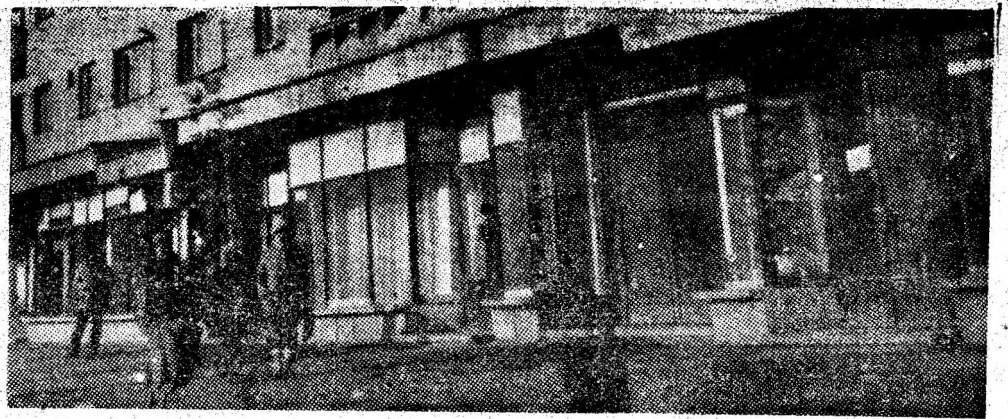
Uricani — imagine din cartierul Bucura.

ANUL XLV, NR. 11 290 | MIERCURI, 4 IANUARIE 1989 | 4 PAGINI — 50 BANI