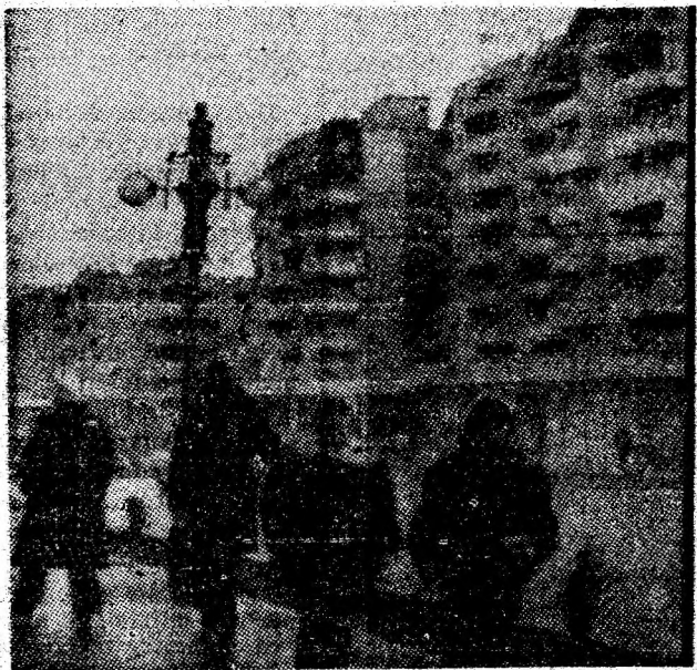
Lupeni — secvență de sezon din cartierul Bărbăteni.