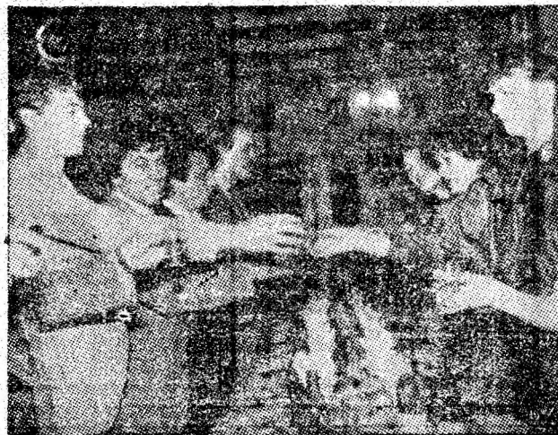
Așa a fost în noaptea de Revelion.