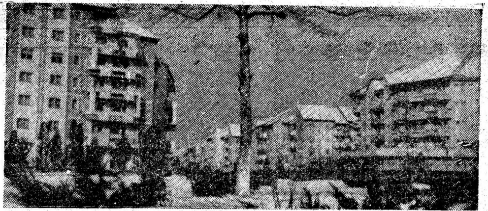
Reședința de municipiu, în plină iarnă.