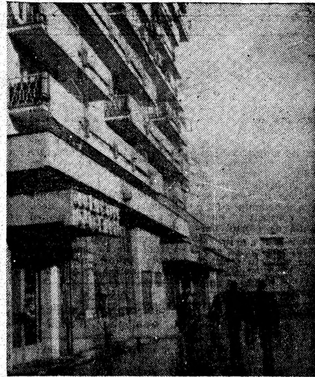
Aspect de pe bulevardul Victoriei din Vulcan.