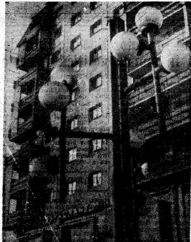
Verticale moderne în reședința de municipiu.