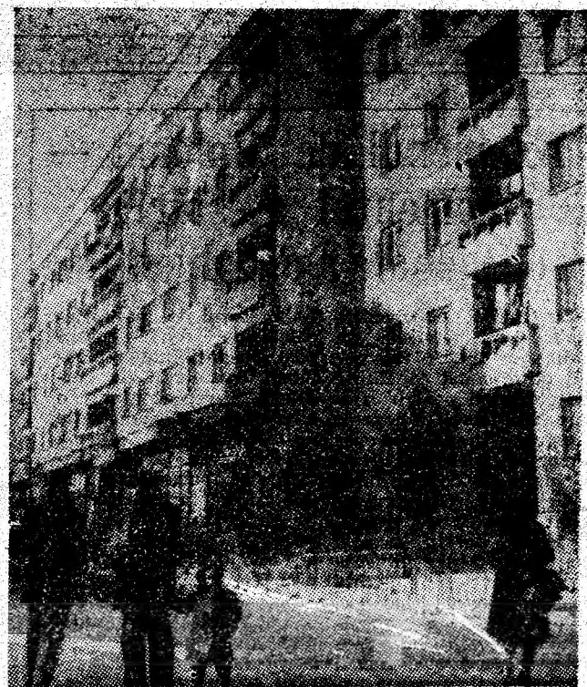
Orașul Uricani cunoaște, pe zi ce trece, metamorfoza înnoirilor edificare. Sub ochii locuitorilor s-a înălțat, cu puțini ani în urmă, cartierul Bucura.