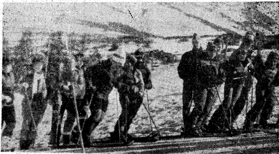
Emoții la start.

Etapa de iarnă a popularelor întreceri din cadrul „Daciadei”, atrage la munte, la ficcare sîrșit de săptămîină, numeroși schiori amatori. Duminică trecută, masivul Paring a cunoscut din nou animația caracteristică acestor întreceri, cu prilejul organizării competiției de schi alpin „Cupa Telescaun”. Beneficiind de o organizare ireproșabilă, de sprijinul Clubului sportiv școlar Petroșani și al corpului municipal de arbitri, competiția a constituit o reușită manifestare sportivă de masă. La start s-au aliniat 70 de concurenți, reprezentînd toate categoriile de vîrstă, iar în lungul pîrtiei, de pe margini, numeroși spectatori și-au încurajat favoriții. Alături de tinerii schiori de performanță din grupele pregătite și instruite de cadre didactice de specialitate de la CSS Petroșani, în concurs au fost prezenți și membri ai formațiilor Salvamont Petroșani și Lupeni, reveniți de curînd de la Raliul republican etapa de iarnă, unde s-au situat pe locuri fruntașe. Aceste