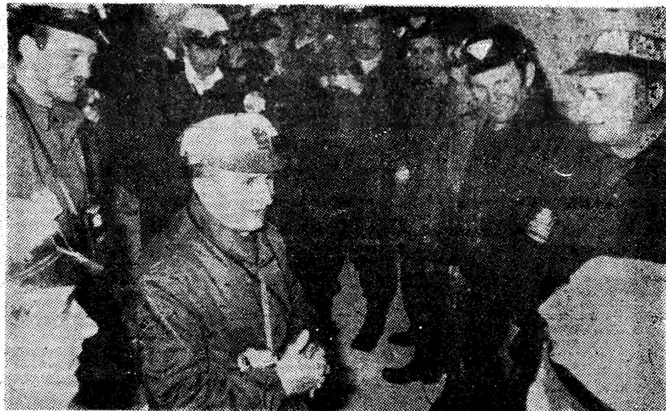
Din fototeca redacției, o imagine-simbol: Tovarășul Nicolae Ceaușescu de vorbă cu minerii în subteran — un nou și rodnic dialog prilejuit de recenta vizită de lucru la mina Lupeni.

Precizez că analiza noastră a condus și la măsuri cu conținut calitativ pentru încadrarea în consumuri, reducerea cheltuielilor, intensificarea recuperării și refolosirii materialelor, în general, pentru rentabilizarea economică — obiectiv aflat în strînsă concordanță cu creșterea producției fizice”.