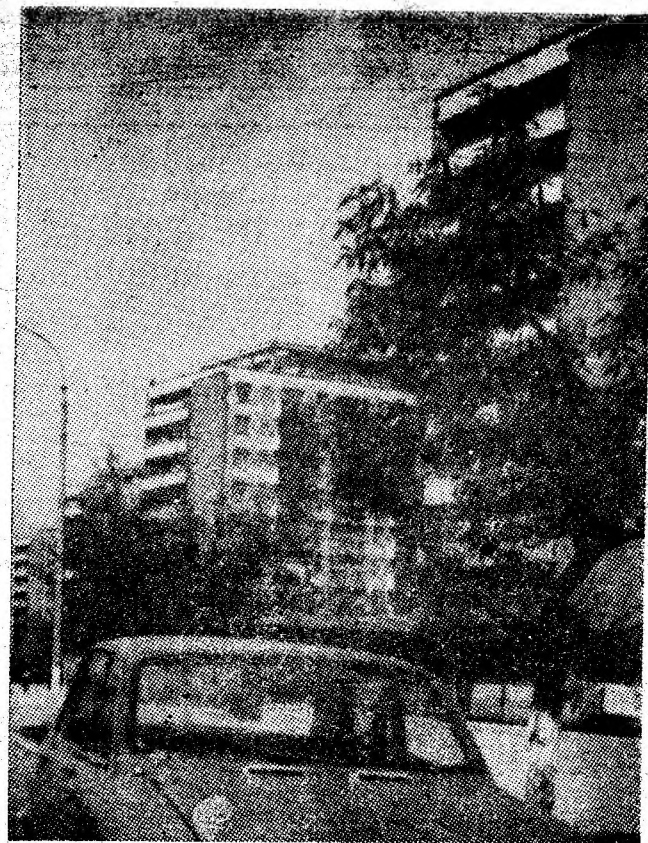
Vulcan — Insemne ale urbanisticii moderne.