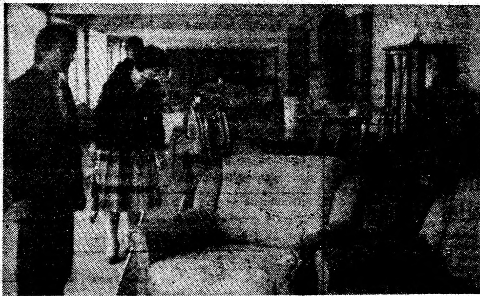
Aspect de la Expoziția de mobilă din Petrița.

strucții și Economia Construcțiilor. Ele au caracteristici tehnice și economice superioare comparativ cu cele ale elementelor care se fabrică în prezent. Așa spre exemplu, noua cuvă poate fi utilizată timp de 20 de ani fără a necesita operații de întreținere și se integrează ușor în componența tuturor tipurilor de captatoare solare. (Agerpres)