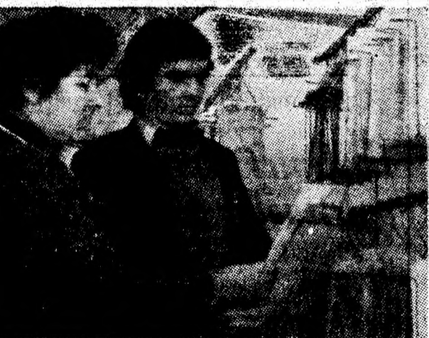
Aspect din unitatea nr. 325 „Tricotaje” din Uricani. Lunar, colectivul magazinului realizează depășiri ale planului.