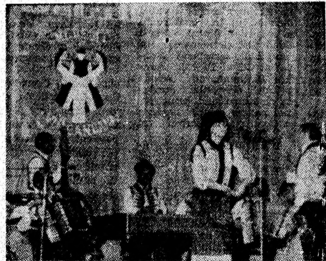
O imagine din concursul „Flori de cîntec românesc”, desfășurat recent, cu succes la Vulcan.