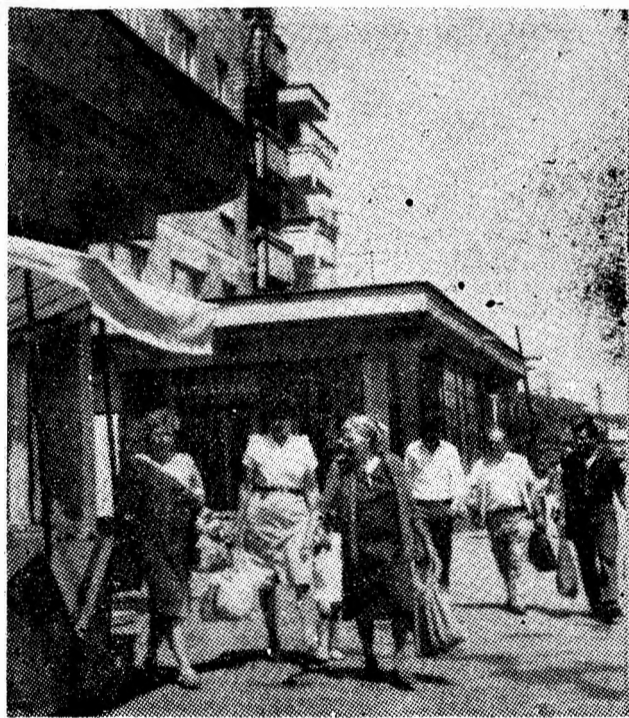
Lupeni — un oraș mereu tînr.

Nu este mai puțin adevărat că aceste formații trebuie să fie mai temeinic sprijinite, atît din punct de vedere al asigurării structurii pe meserie cît și al întăririi disciplinei tehnologice. Problema realizării obiectivelor de investiții la mină este mult prea importantă încît să nu se acorde atenția cuvenită, sub toate aspectele.