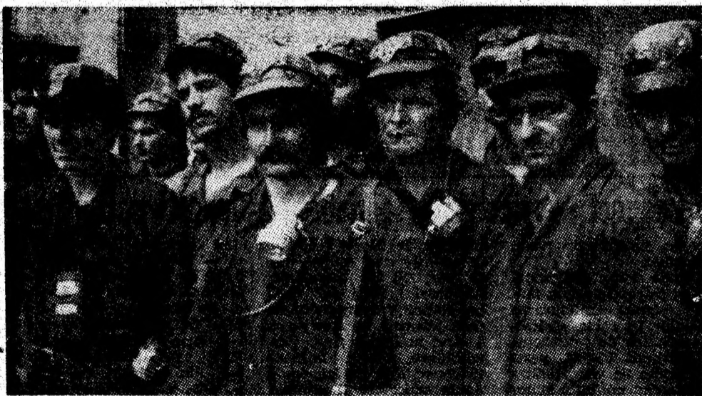
Mineri din sectorul VI al IM Lupeni, unul dintre sectoarele fruntașe ale minei.