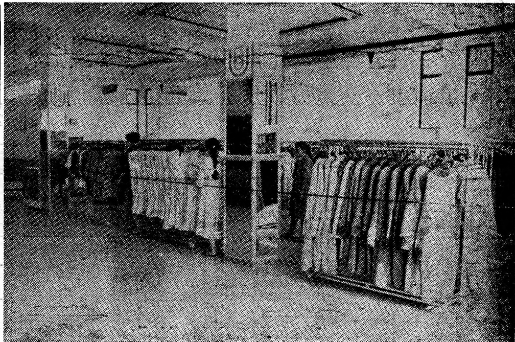
Servire modernă, civilizată în noile spații comerciale ale magazinului general din Uricani.