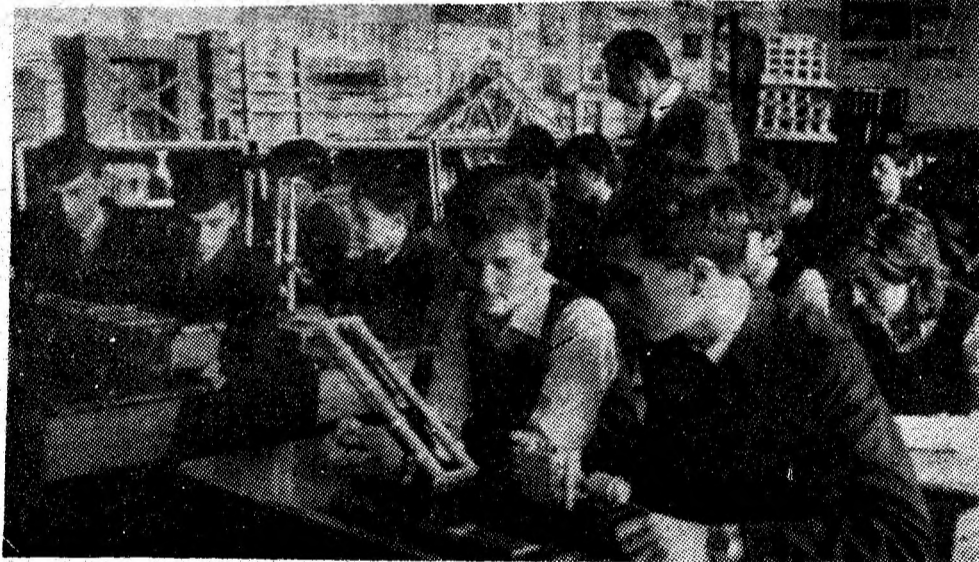
Prima oră de curs în unul din modernele laboratoare ale Liceului industrial din Petroșani.

Într-o deplină unitate de gând și de voință cu întreaga țară, participanții la adunarea festivă și-au exprimat fierbinta adevărată propunere privind re alegerea tovarășului Nicolae Ceaușescu, la Congresul al XIV-lea, în funcția supremă de secretar general al Partidului Comunist Român, chează la înfăptuirea cu tezătoarelor obiective de dezvoltare multilaterală a patriei, a înaintării neabătute spre orizonturile luminoase ale comunismului.