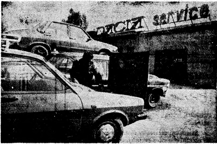
Imagine cotidiană de la unitatea „Dacia service” din Petrila.