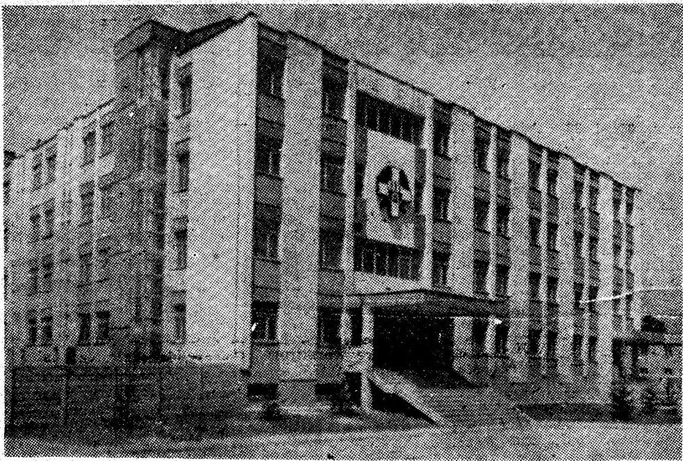
Clădirea centrului de salvare minieră a CMVJ.

narea procesului de extracție ci și în menținerea unui grad ridicat de siguranță a muncii. În formația, atât de necesară luării unor decizii prompte și eficiente, circula cu rapiditate grație rețelei de convorbiri. Prin moderna instalație de telegizumetrie, se veghează în mod permanent asupra asigurării unui climat corespunzător în subteran. Cele 16 puncte de măsurare automată a concentrațiilor de metan permit un control riguros, capacitatea instalației respective fiind mult mai mare. Pe măsură ce vor fi puse în funcțiune noi capacități de producție, se vor instala alte puncte, conectate la instalația de telegizumetrie, care funcționează ireproșabil — aceasta și datorită calității lucrărilor executate cu competență, într-un timp record, de inimosul colectiv de specialiști din cadrul sectorului electromecanic. (C.T.D.)