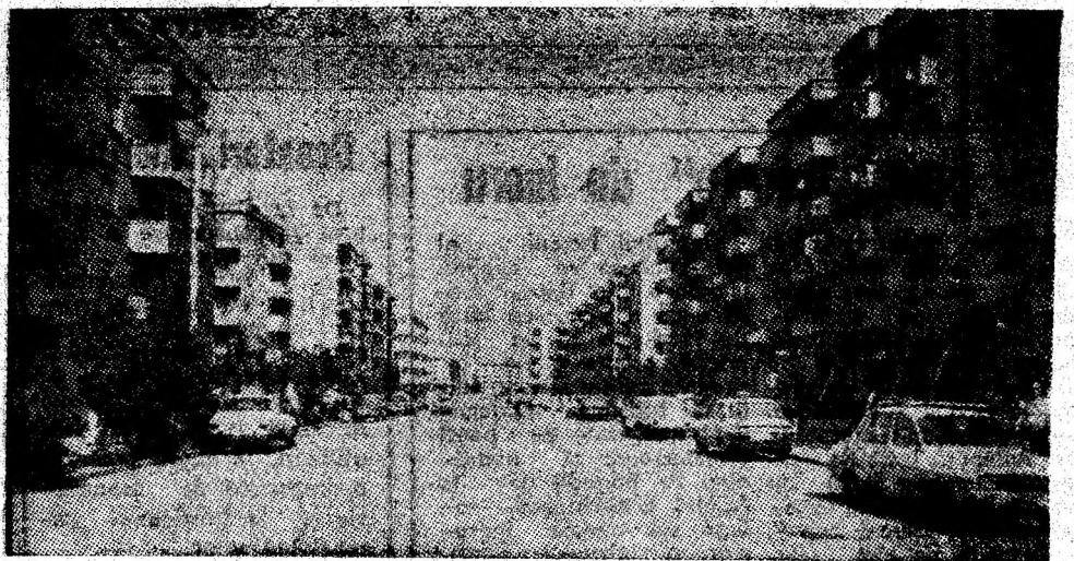
Uricani - imagine concludentă a prefacerilor înfăptuite în acest înfloritor oraș.