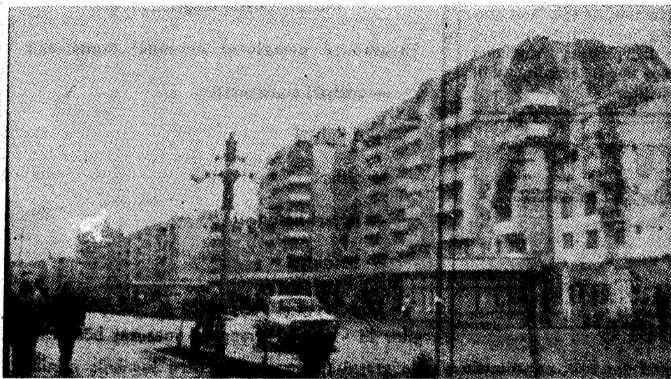
Orașul Lupeni, în anii construcției socialiste, s-a reconstruit, fiind astăzi în întregime un oraș cu un înalt grad de modernizare. În imagine, aspect din noul centru civic al orașului, înscris cu pregnanță pe calea devenirii socialiste.

Construcțiile de locuințe din Valea Jiului au cunoscut în ultimii ani, o amploare fără precedent, care au transformat localitățile de altădată ale municipiului în puternice așezări muncitorești.