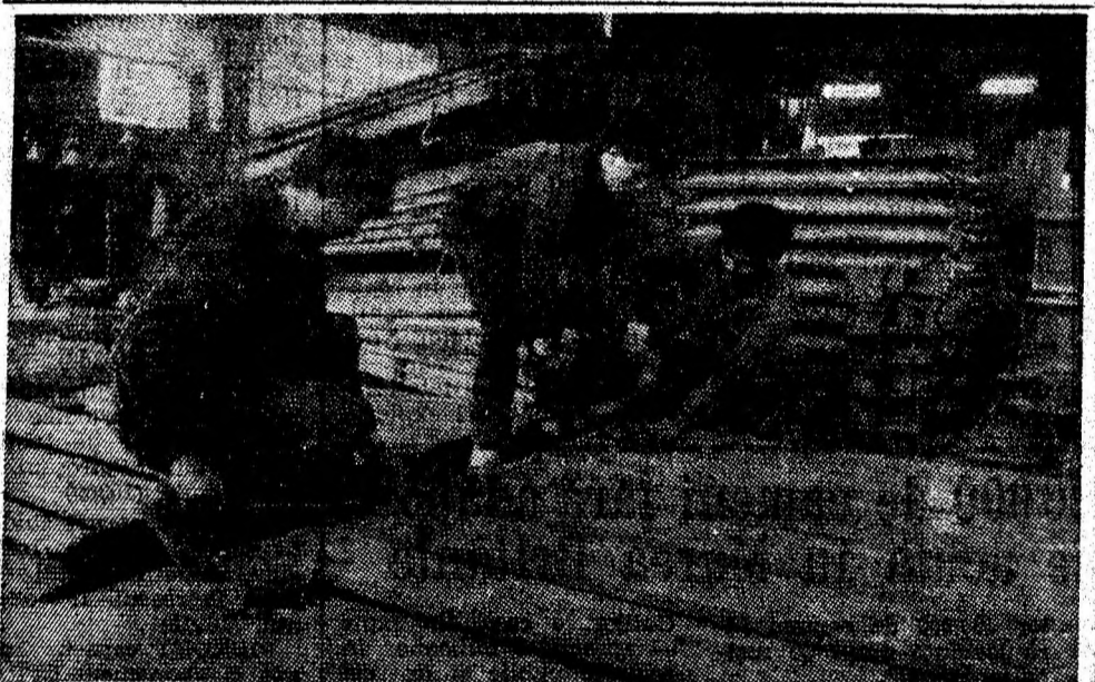
IPS RUEEMP, secția Livezeni. Aspect din activitatea brigăzii Șefu Vladislav, care execută confecții metalice de bună calitate.

La întreprinderea minieră din Aninoasa va avea loc în zilele următoare o masă rotundă cu tema „Contribuția tovarășului Nicolae Ceaușescu, secretar general al partidului, la democratizarea relațiilor internaționale”. Această manifestare politico-ideologică este organizată, în spiritul documentelor programatice ale Congresului al XIV-lea al partidului, de consiliul orașenesc de educație politică și cultură socialistă.