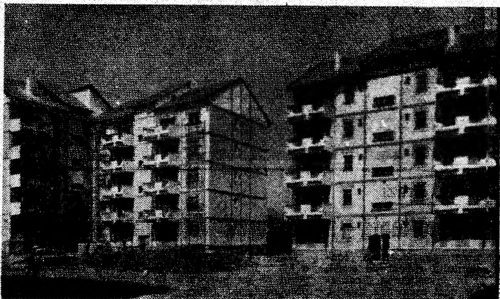
Moderne și frumoase blocuri de locuințe se înalță marea în cel mai nou oraș al Văii Jiului — Aninoasa.

tră — una dintre ctitoriile „Epocii Nicolae Ceaușescu” — se va extinde și moderniza. Sarcinile de producție sînt mobilizatoare. De aceea sîntem hotărîți să acționăm cu toată energia pentru perfecționarea întregii noastre activități economice și politice, să realizăm o producție tot mai mare, superioară calitativ, competitivă la export, la nivelul exigențelor partenerilor interni și externi. Aplicînd creator orientările date de secretarul general al partidului, în cuvîntarea rostită în încheierea lucrărilor Congresului, vom acționa cu toată energia pentru a înălța în România socialismul și comunismul — cea mai dreaptă și mai umană societate.