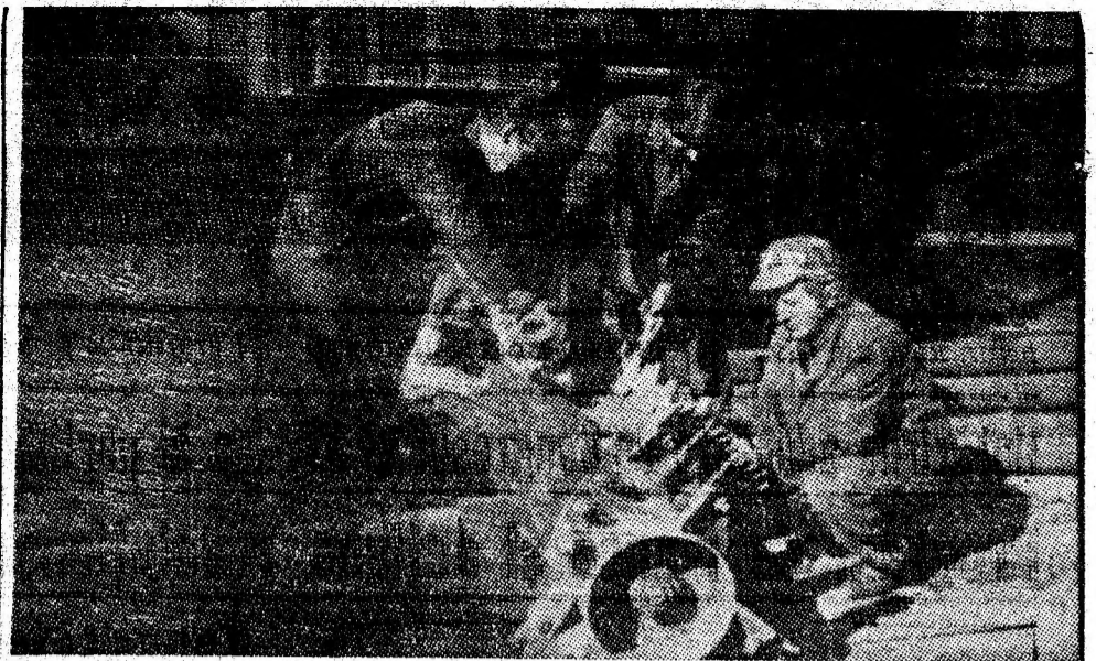
La IM Uricani, o atenție majoră se acordă autoutilării. Imagine de la atelierul mecanic, unde se lucrează la mașina de curățat vagonete.