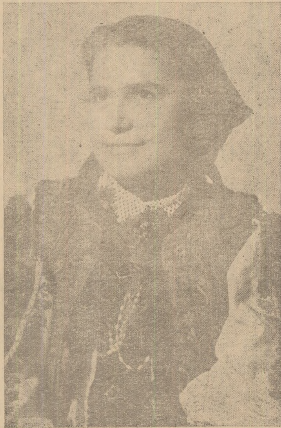
FAȚA DIN GHELAR