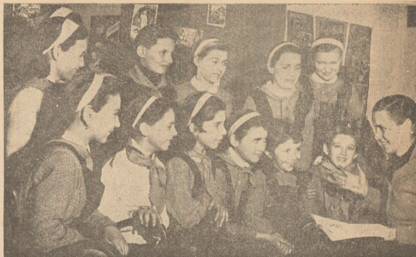
Seară de basme cu pionierii școlii, la biblioteca clubului „11 Iunie“ Gă