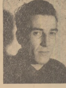
GAMAN LAMBACHE macaragiu secția O.S.M. I a combinatului siderurgic Hunedoara