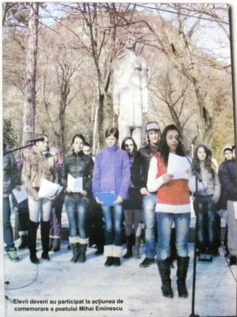
Elevii deveni au participat la acțiunea de comemorare a poetului Mihai Eminescu

Zeci de elevi de la școlile din municipiul Deva, însoții de cadre didactice, s-au strâns în parcul de la poalele Cetății. În fața statuiei care-l reprezintă pe Mihai Eminescu, pentru a-l serba pe marele poet român. Elevii școlilor au recitat poezii eminesciene și au depus flori. Au fost prezentate secvențe din spectacolele și serbările școlare dedicate Poetului,