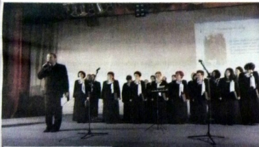
Corala „Sargeția” a interpretat cântece pe versuri eminesciene