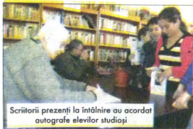
Scriitorii prezenți la întâlnire au acordat autografe elevilor studioși