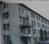
Biblioteca din Hunedoara va găzdui un concert de jazz, dar și trei lansări de carte