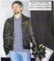
Regizorul Adrian Sitaru, născut în Deva, o răsunat capului bibliotecii județene