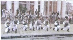
Ansamblul „Hațegana” a susținut un spectacol folcloric la Hunedoara

le-a explicat celor prezenți manifestare cum sentimentele fi trăit și în zilele noastre, astăzi vorbim din nou despre veche temă, dar din nou este vorba despre unirea cu Moldova. În momentul în care Moldova va intra în UE, va reveni acasă, în Europa tural de România”, a spus La Petroșani, 24 ianuarie a dublă semnificație, fiind care a fost înființat Forumul Urbis. Acesta a adunat în sale oameni din toate domeniți într-un scop comun, a de a promova valorile locale și a ajuta reciproc. Forumul a doi ani și la începutul anului a fost transformat în asocia