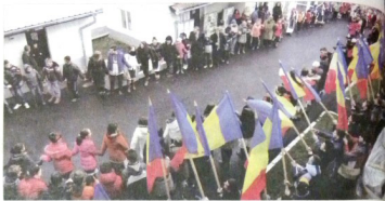
În curtea bibliotecii județene a fost înfăptuită o horă a unirii

Vineri, după prânz, în Sala „Liviu Oros” a Centrului Cultural „Drăgan Muntean” din Deva, elevilor de liceu li s-a prezentat portretul lui Alexandru Ioan Cuza, iar în final, acestora le-au fost adresate întrebări legate de Unirea din 1859. Cei care au răspuns corect au fost recompensați cu premii constând în cărți și diplome oferite de biblioteca județeană. „Și în acest an, evocarea Unirii Principatelor a atras un numeros public și am avut bucuria „să dăm mână cu mână”